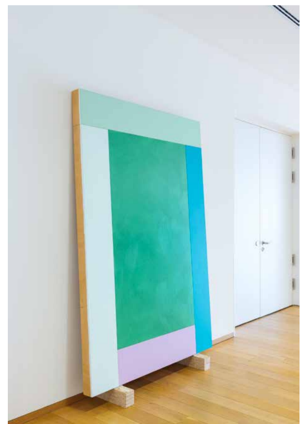
Imi Knoebel, «Lady 4», 1998, ©2026 Pro Litteris.