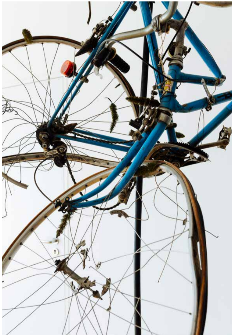
Thom Merrick, «Fin de Cycle», 1993, ©2026 Pro Litteris.

Darüber hinaus erreicht die Sammlung durch Leihgaben an Museen und Institutionen ein breiteres Publikum. Ein besonderer Fokus auf Künstlerpublikationen hat zur «Kienbaum Artists' Books Edition» geführt, die auch als Geschenk für Kunden und Partner dient und den Dialog zwischen Kunst und Unternehmenswelt weiter stärkt.